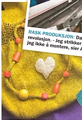
LOGO: Et påsydd tovet hjerte er blitt tobarnsammaens designsignatur.